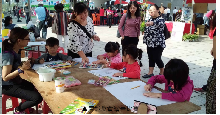
▲廉能反貪繪畫比賽