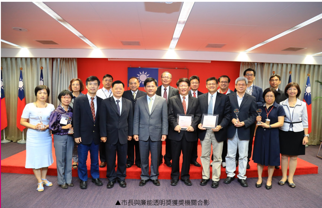
▲市長與廉能透明獎獲獎機關合影

本次獲獎機關包含本府一、二級機關、區公所及地政事務所，於 105 年 10 月 31 日市政會議中，在外聘委員見證下，由林市長頒獎公開表揚，除鼓勵獲獎機關對於推動透明化措施之努力，並希望藉此激勵本府各機關將推動透明化蔚為風尚。