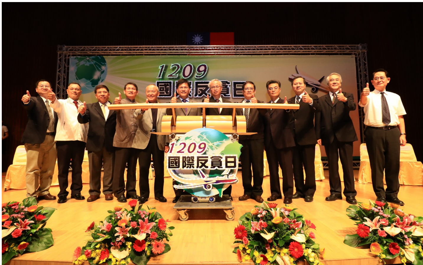
▲本府邀集法務部、經濟部、廉政署、水利署、臺中榮總、苗栗、南投、雲林、彰化等機關共同參與領航啟動

為強化公私部門對反貪腐的參與，法務部廉政署結合中央及地方政府，於今(2016)年11月9日至12月9日期間，依序在中部、南部、東部、北部等四個地區，舉辦「1209國際反貪日系列活動」，透過論壇、展覽、座談會、辯論賽、兒童戲劇等多元方式，擇定機關、民眾或公務員相關廉政議題，進行理論探索與實務研究，以凝聚營造透明社會及廉潔文化之共識，藉由一系列活動引領民眾主動關切廉政事務，進而型塑貪污「零容忍」的社會風氣，呼籲全民支持誠信倡廉運動，發揮民眾外部監督力量，共同監督政府廉潔與透明。