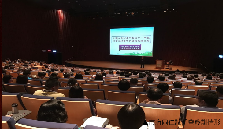
市府同仁說明會參訓情形