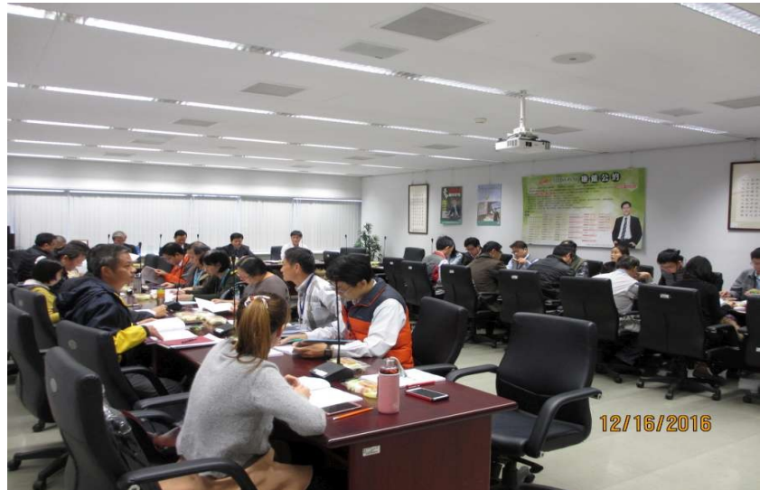
▲召開「105 年度提升採購稽核效能會議」情形