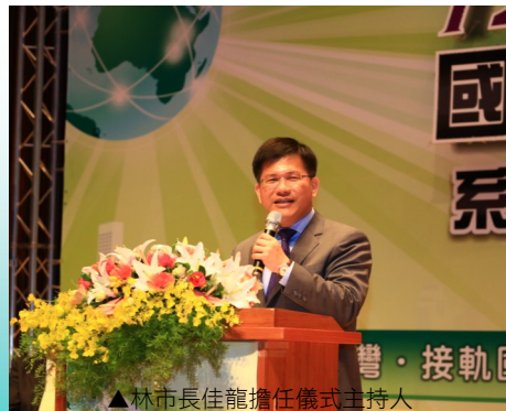
▲林市長佳龍擔任儀式主持人

列活動聯合啟動儀式」，由林市長佳龍擔任儀式主持人，以「廉能政府 透明臺灣 接軌國際 中部領航」為核心主軸，邀集法務部、經濟部、廉政署、水利署、臺中榮總、苗栗、南投、雲林、彰化等機關共同參與領航啟動，象徵各機關同心合作致力貫徹廉能透明，攜手點亮廉能希望；並創新於會場外設置廉能展示專區，本市提出本年首度舉辦「廉能透明獎」得獎優質案例、廉能透明向前行廉政座談會等相關成果，另包含彰化、南投、苗栗、雲林廉能專區、臺中榮總廉能專區、經濟部水利署廉政透明智慧管理專區及臺中市水利局廉能專區等八大區，聯合行銷年度廉政工作成果，共同展現廉能反貪正面能量。