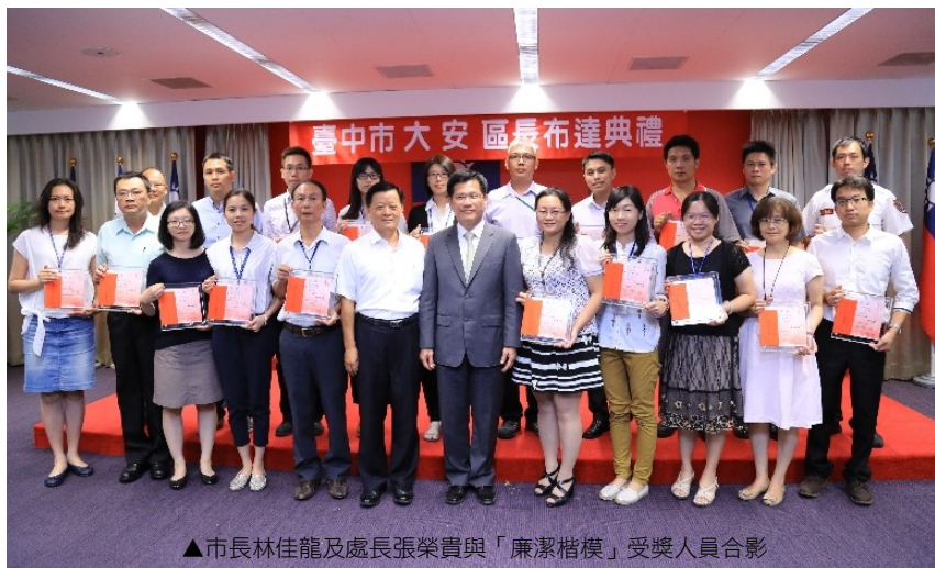
▲市長林佳龍及處長張榮貴與「廉潔楷模」受獎人員合影

為提升廉潔效能，鼓勵員工崇法務實、廉潔自持，市長林佳龍 8 月 29 日在市政會議親自頒獎表揚 20 位「廉潔楷模」，藉由優良廉潔楷模之表揚，以收激濁揚清之效並深化基層廉能公務倫理。