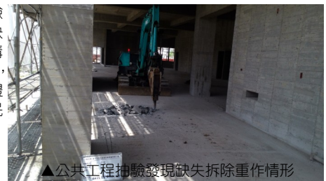
▲公共工程抽驗發現缺失拆除重作情形

失範圍擴大，並檢視工程採購有無潛存不法情事，即時查處，達成防貪與肅貪的目的，具體降低貪腐的可能性，保障人民的權益。