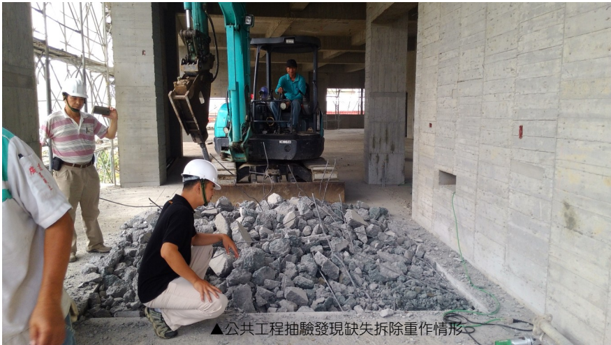
▲公共工程抽驗發現缺失拆除重作情形

公共工程係國家發展及政府政策的重要體現，更直接影響民眾對施政之感受，市府政風處為協助各機關提昇是項業務品質，積極辦理工程抽驗，又為更深入及精準執行是項作業，自 104 年 11 月起每案聘任 1 名工程專家學者會同辦理抽驗工作，藉由渠等專業能力增進抽驗工作之深度及廣度，提升市府公共工程施工品質。