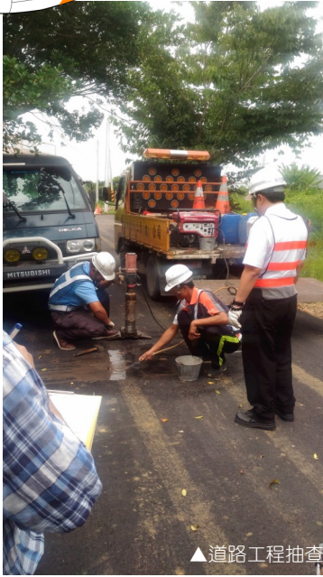
▲道路工程抽查驗現場執行情形