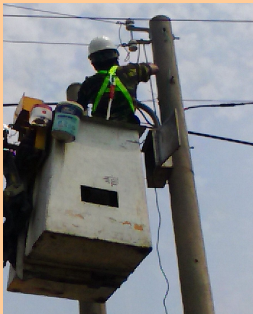
▲水銀路燈落日計畫稽查情形

政風處於「水銀路燈落日計畫辦理方式研商」會議，特別提出行政院公共工程委員會依據審計部來函之相關注意事項，尤應特別注意價格問題等意見，案獲重視與採納，列入會議紀錄，並做成「編列預算單價時請確實進行訪價作為」之結論。為落實預防貪瀆之預警功能，業機先採取防範導正作為，並於公共工程品質推動委員會 105 年第 2 季會議臨時動議提案，請本府建設局確依法令及契約等相關規定落實執行，以避免外界質疑及弊端情事發生。本案基於興利預防立場，將持續督同建設局政風室做好內稽內控機制，展現興利防貪作為，以確保施工成果符合其設計及規範之品質要求，並提升工程施工品質。