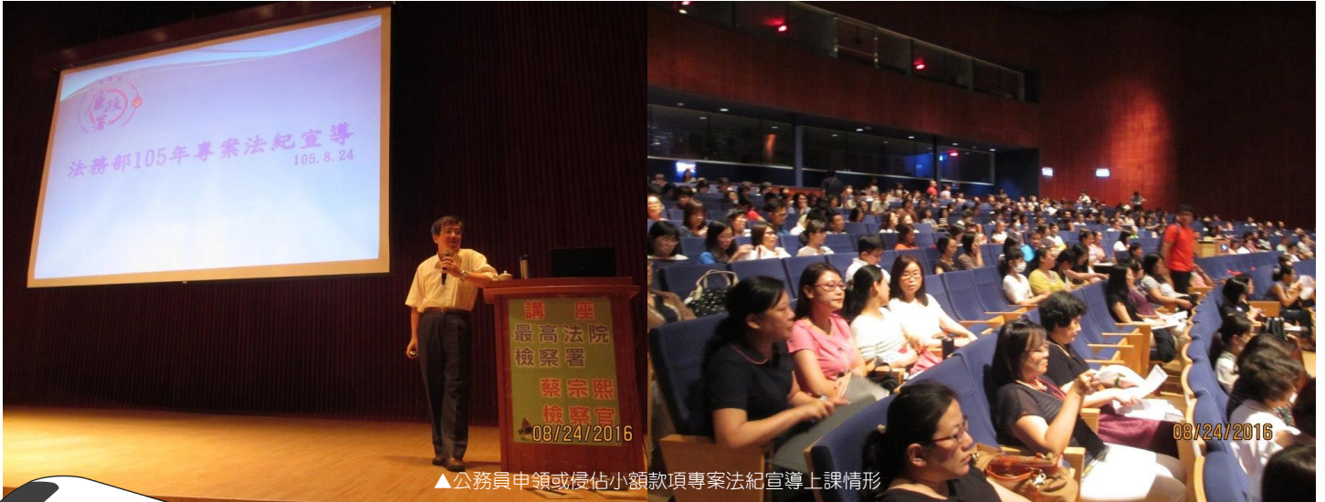
▲公務員申領或侵占小額款項專案法紀宣導上課情形