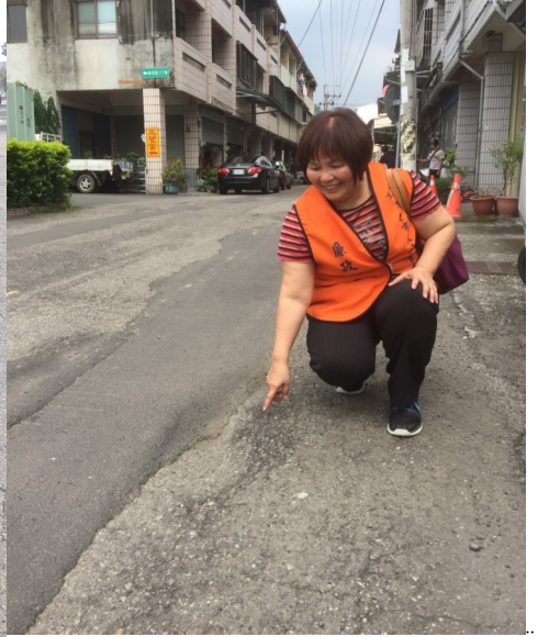
▲廉政志工協助本府道路工程策進專案情形