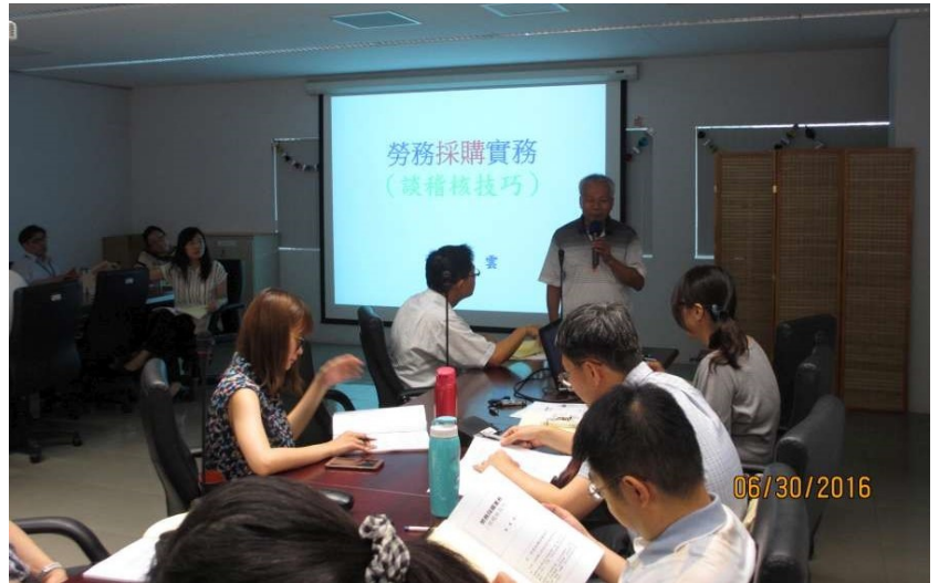
▲採購稽核人員參與勞務採購實務研習情形