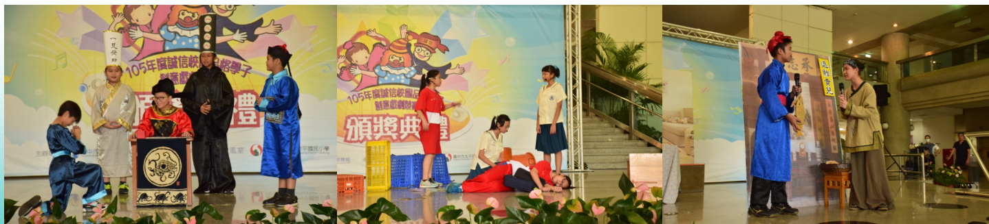
▲國小組第一名九德國小演出「一桿秤仔 2.0」

教育局表示，得獎作品將錄製成專輯光碟分送至臺中市所屬各級學校示範推廣，未來這些得獎隊伍也有機會受邀至戶外演出，繼續宣導誠信、倡廉，反貪的精神。